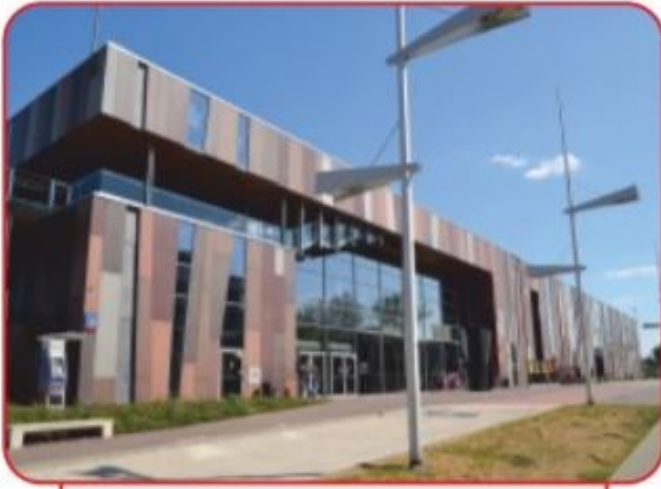
Centrum Nauki Kopernik