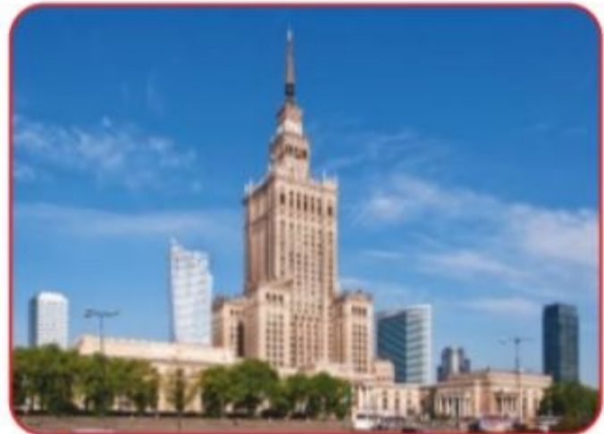
Pałac Kultury i Nauki