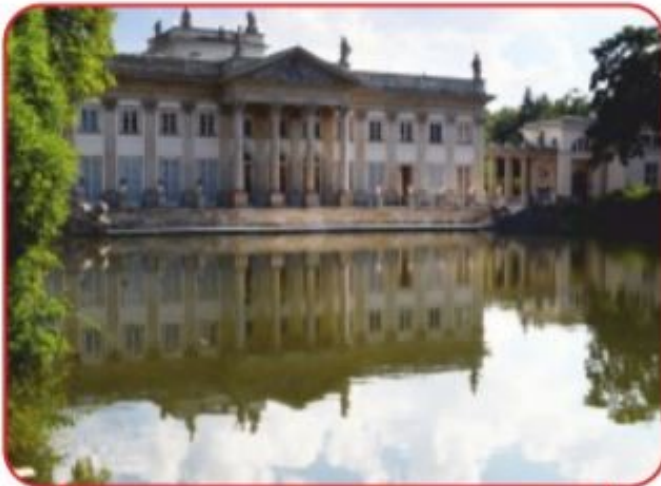
Pałac w Łazienkach