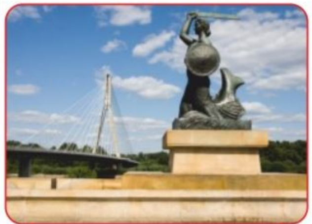
Syrenka nad Wisłą